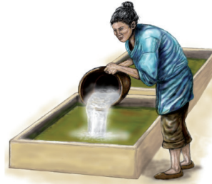
avant d'être cuit et mélangé à de la chaux.