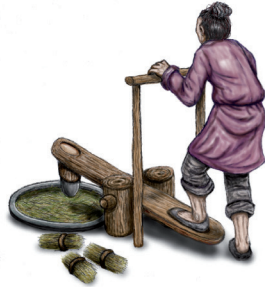
coupé en petits morceaux et écrasé à la meule,