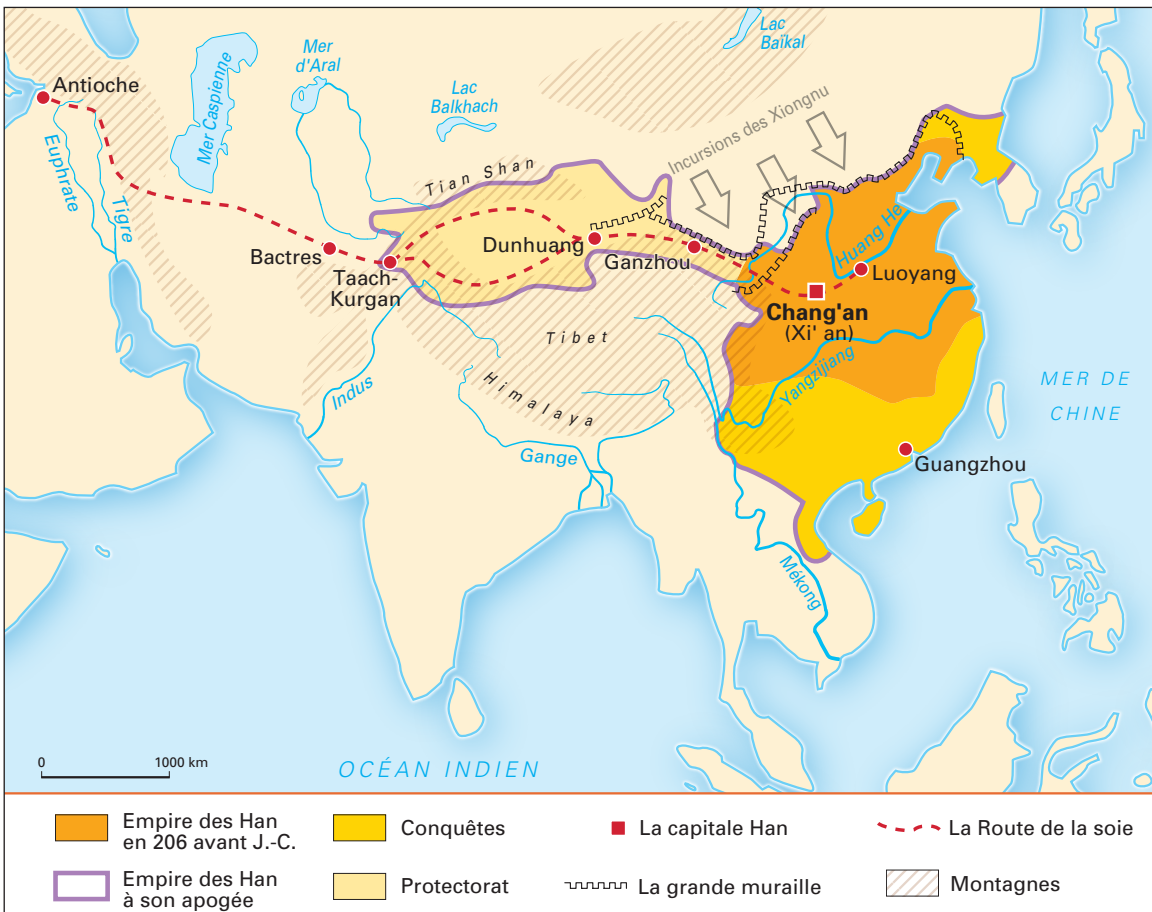
L'expansion de l'empire des Han