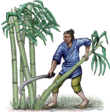
Le bambou est d'abord cueilli,